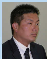
熊本ヤマハ株式会社 代表取締役社長