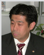
株式会社明和不動産 経営企画室 システム課