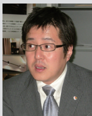
株式会社明和不動産 経営企画室 室長

熊本地区を中心に事業を展開し、九州でトップクラスの業績を誇る明和不動産様。賃貸事業をはじめ、不動産管理、資産活用コンサルタント、マンション開発と事業領域を着実に拡大しています。アパートオーナー向け提案物件の自社ブランド化や、デベロッパーと組んでのマンション開発など斬新な発想、行動力が強みです。