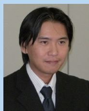
熊本ヤマハ株式会社 システム部